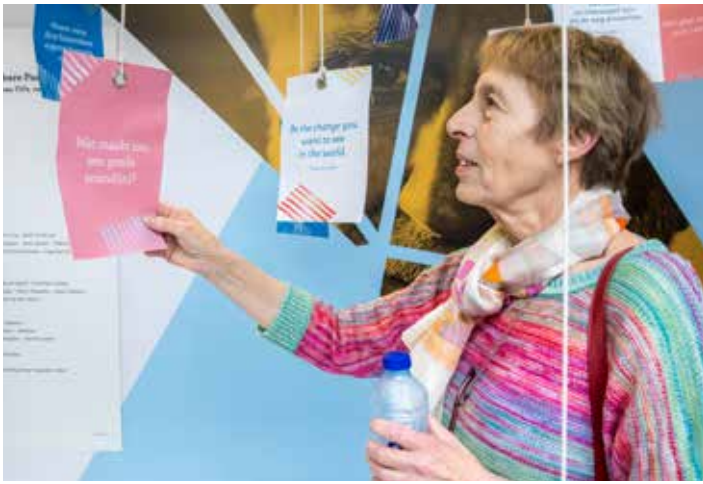
Tijdens de Parkinson Werelddag op dinsdag 11 april kwamen 120 parkinsonpatiënten samen in het UZA voor lezingen en workshops.

→ heb ik een verstandige man en kinderen.’ De impact op haar gezin vindt ze een van de lastigste gevolgen van de ziekte. ‘Ik was altijd de dragende kracht binnen ons gezin. Door mijn ziekte werd de grond dus ook vanonder hun voeten weggevaagd. Maar uiteindelijk zijn we er sterker uitgekomen.’