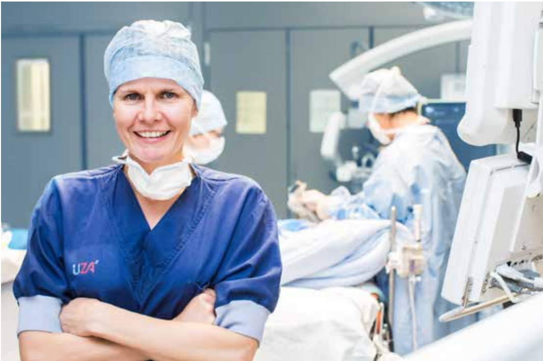
Bij hersentumoren werken de kinderneurochirurgen nauw samen met de kinderoncologen en kinderneurologen, om te bepalen wat de beste optie is voor de patiënt.

Sommige tumoren kun je met een operatie niet verwijderen, omdat je dan vitale functies verstoort